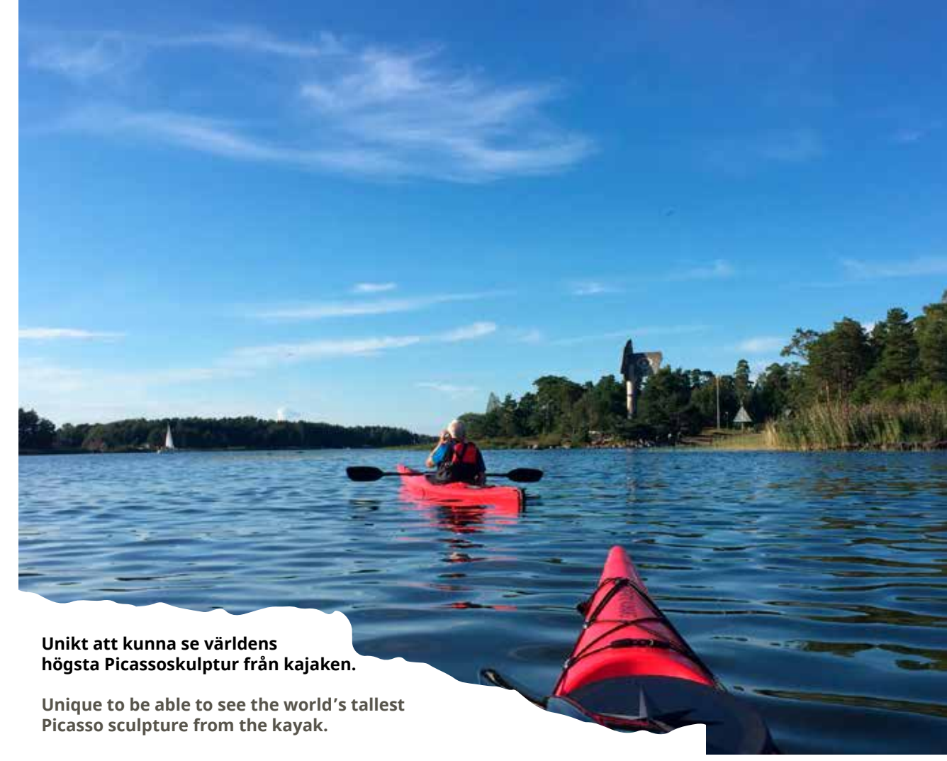
Unikt att kunna se världens högsta Picassoskulptur från kajaken. Unique to be able to see the world's tallest Picasso sculpture from the kayak.