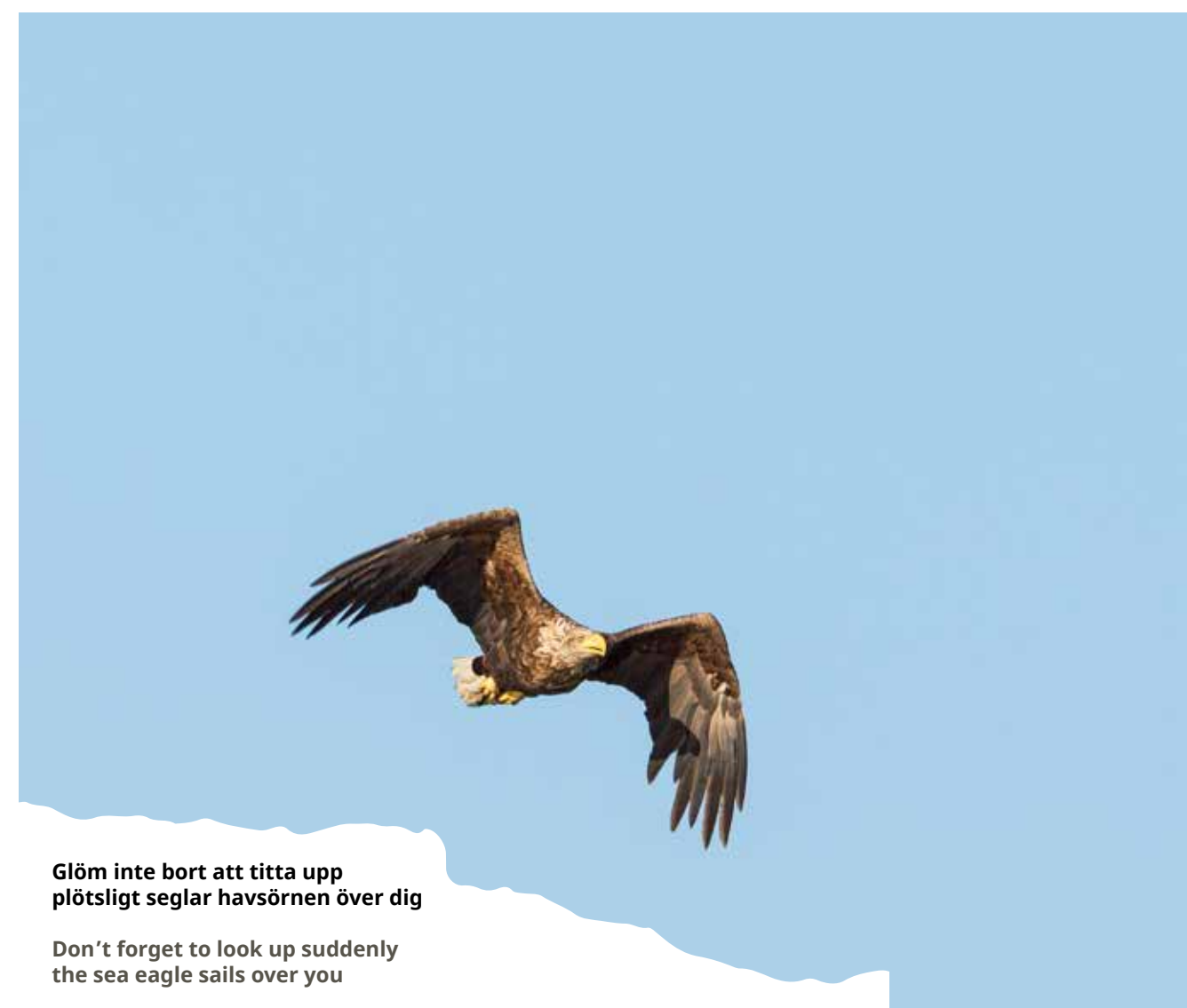
Glöm inte bort att titta upp plötsligt seglar havsörnen över dig. Don't forget to look up suddenly the sea eagle sails over you